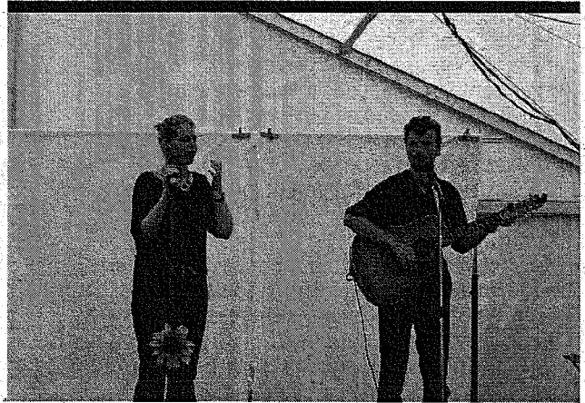
Les deux artistes du groupe "L'un dans l'autre" ont proposé un agréable spectacle.

Après le repas, différentes activités s'offraient aux visiteurs : le manège et la pêche aux canards pour les plus petits, et les autos-tamponneuses, le concours de tir (ball-trap), les pincés à peluches... pour les plus grands.