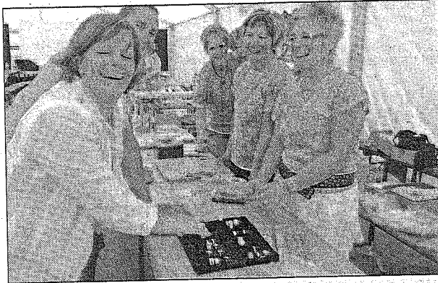
La vente de bijoux, un petit plus pour le comité des fêtes